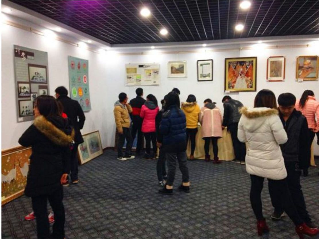
图书馆 艺术设计系